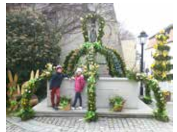
Ich wünsche dir viel Freude beim Gärtnern!

und Zeichen des Lebens für Mensch und Tier gewürdigt werden. Vielleicht machst du dir selbst einen Kranz für die Haustüre oder Weidenkätzchen in einer Vase mit selbst bemalten Eiern.