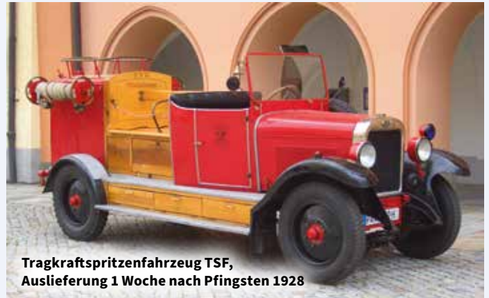
Tragkraftspritzenfahrzeug TSF, Auslieferung 1 Woche nach Pfingsten 1928

1996 gründeten sammelbegeisterte Mitglieder der FFW Pfarrkirchen den Verein „Freunde der alten Feuerwehr Pfarrkirchen“. Sie wollten damit zur Erhaltung und Restaurierung alter Gerätschaften und Fahrzeuge beitragen, die bei der Feuerwehr Pfarrkirchen seit deren Gründung im Jahre 1865 verwendet wurden. Daraus entwickelte sich ein kleines, aber feines Museum, in dessen Ausstellungsraum sich etliche Raritäten aus der vergangenen Epoche befinden: alte Messinghelme, strohgebundene Einsatzstiefel, alte Uniformen, Pferd dekutschen, eine der ersten, bereits mit Holzreifen versehene Schiebeleiter (komplett aus Holz hergestellt!) und diverse Einsatzgeräte. Das Schmuckstück der Sammlung ist definitiv ein alter Opel aus dem Jahre 1928, das erste motorisierte Einsatzfahrzeug der Feuerwehr Pfarrkirchen.