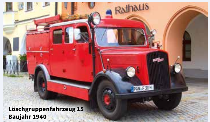
Löschgruppenfahrzeug 15 Baujahr 1940

Die Besichtigung ist nach Vereinbarung möglich.